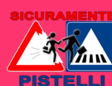
#StreetsForKids #KidicalMass cleancitiescampaign.org/streetsforkids